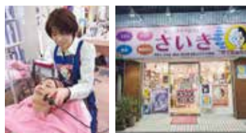
施術風景と外観。花小金井駅徒歩7分。駐車場完備。ファミリーマート前で分かりやすい

超破格の体験プランに会員になれば、その後だが、中身は本格フェイも4000円台まで通え。約2時間の充実したコースで、3種類のマシンを使い、①ディープ「もつと早く来れ