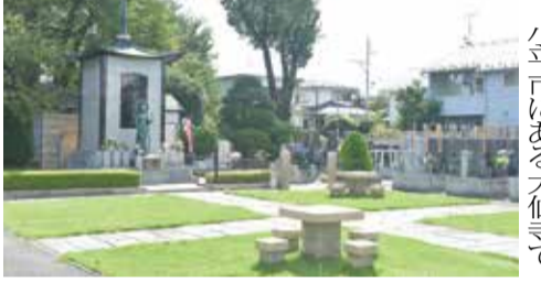
明るい雰囲気評判。江戸末期の浮世絵師・歌川国芳の墓もある