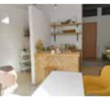
落ち着いた雰囲気のカロン

歩くのがつらい、出掛けるのが憂うつ... 足の巻き爪のせいではないかと悩んでいる方は、ぜひお気楽に、状態を見せてください。