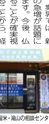
東久留米・滝山の相談センター

「一人」対「一人」ということで、ぜひいろいろな業者と会って、比べてみてください。