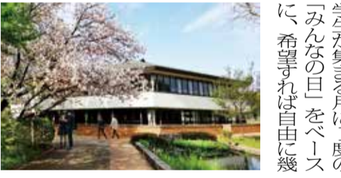
東久留米市にある自由学園