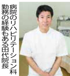
病院のリハビリテーション科勤務の経験もある由代院長

「一回の施術で楽になり夜もぐっすり眠れるようになった」と60代女性。など評判の同院では、カウンセリングの 「椎管狭窄症」に苦しんでいるなら、約30年のベテランがいる「たしろはりきゅう院」へ。