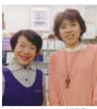
明るいスタッフが迎えてくれる